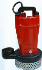
ปั๊มน้ำสะอาด รุ่น AQ2-22550